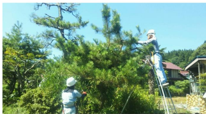
R3.8.6 松の手入れ講習会